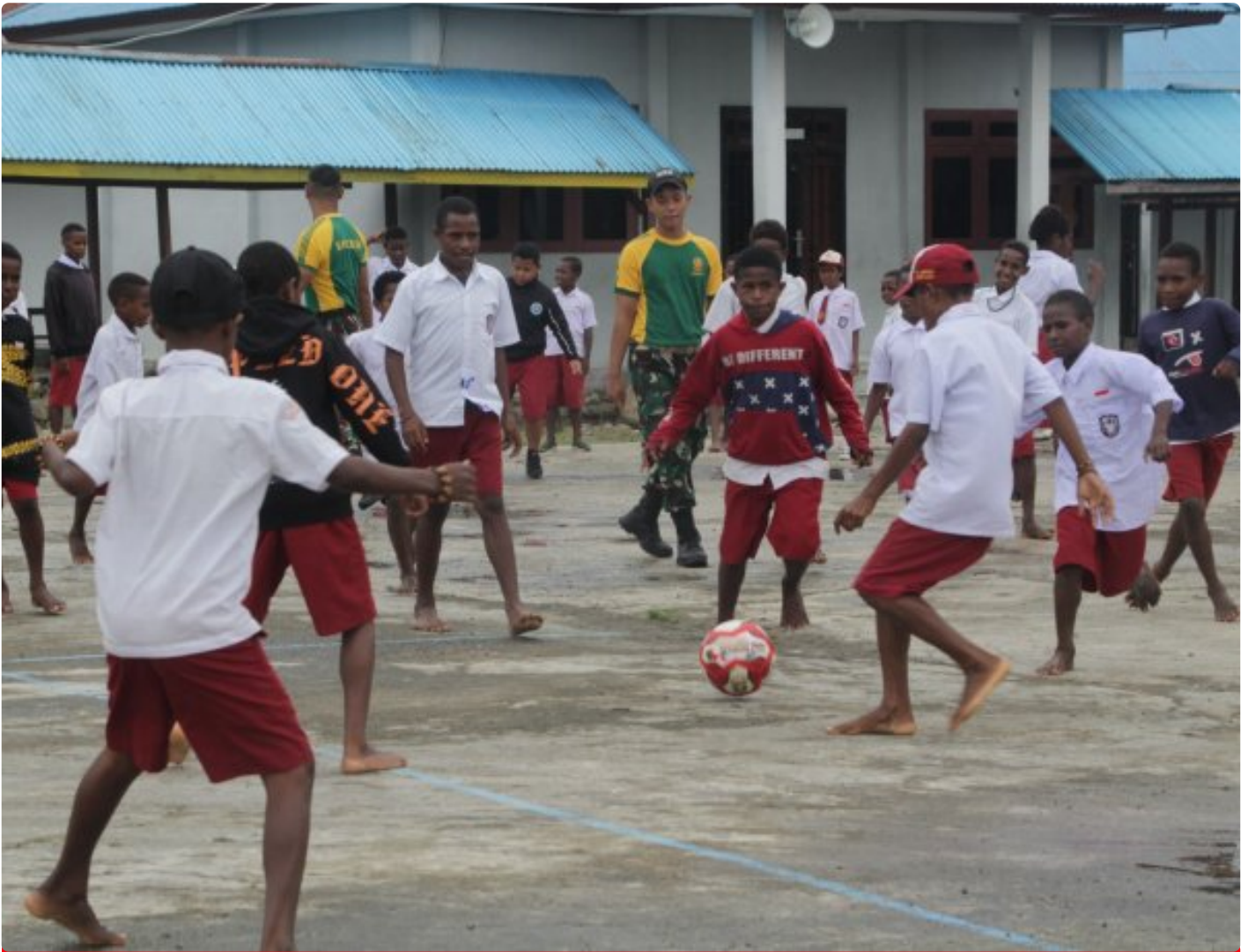
Foto: Saat Satgas Pamtas Mobile RI-PNG Yonif 503/Mayangkara mengajak main sepak bola siswa SD Inpres Kenyam, Distrik Kenyam, Kabupaten Nduga, Papua, Kamis 6 Febuari 2025.