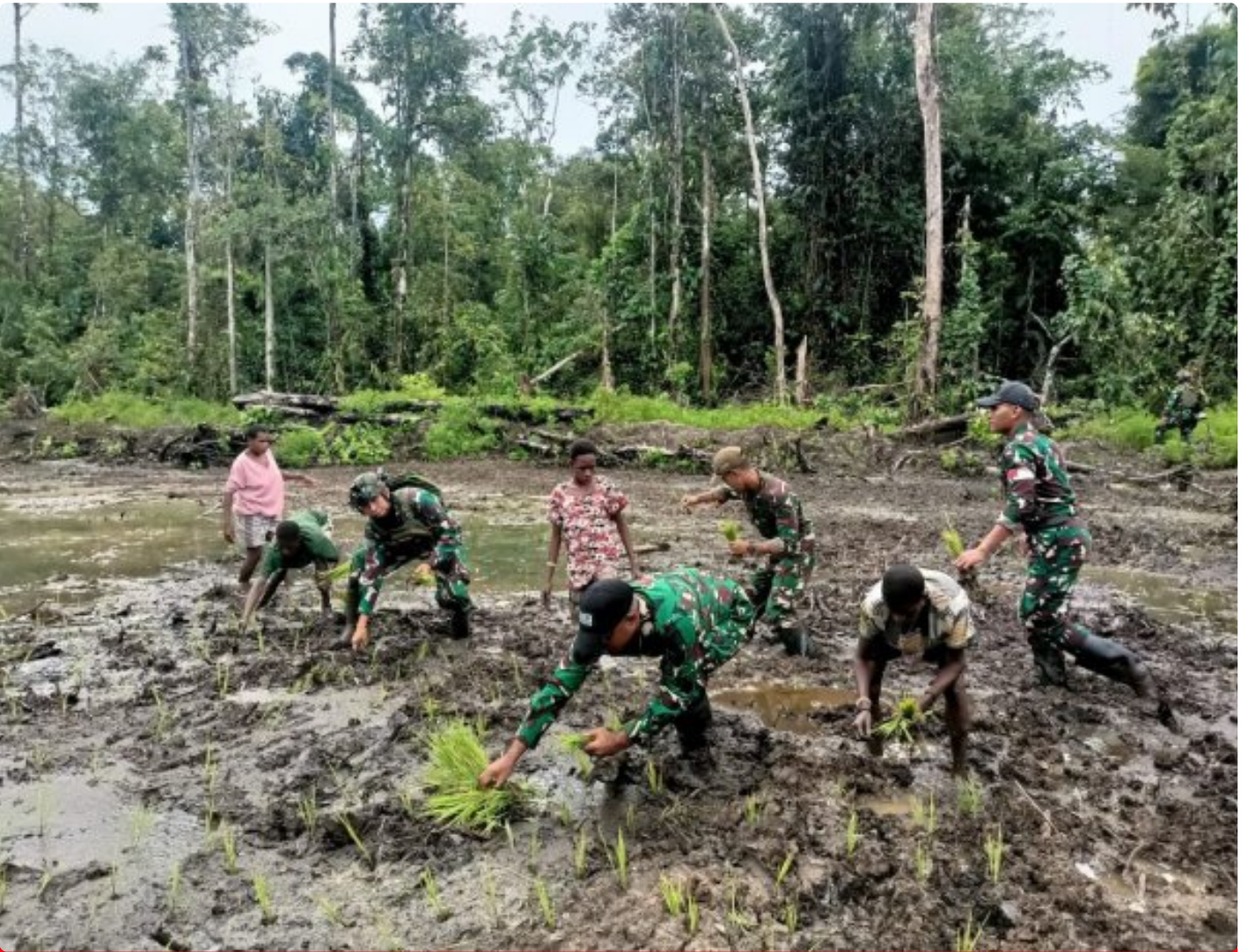
Foto: Satgas Pamtas Mobile RI-PNG Yonif 503/Mayangkara menggagas program ketahanan pangan yang melibatkan langsung warga Kampung Mumugu, Distrik Krepkuri, Kabupaten Nduga, Selasa (07/01/2025).