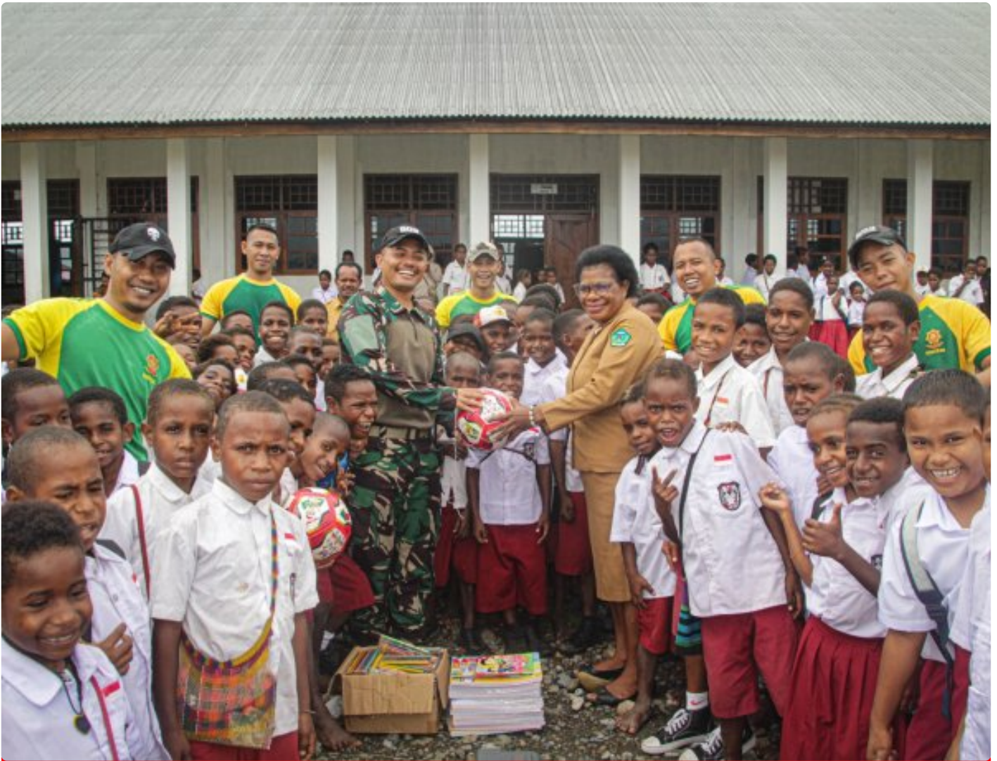
Foto: Satgas Pamtas Mobile RI-PNG Yonif 503/Mayangkara mendistribusikan sarana belajar ke SD Gabungan Distrik Kenyam, Kabupaten Nduga, Papua, pada Minggu (09/02/2025).